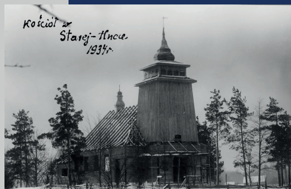
Kościół w Hucie Starej, 1934 r.