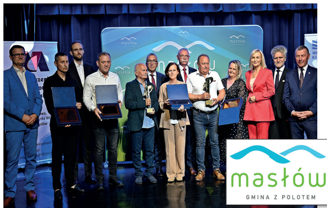
Laureaci i nominowani z gośćmi i gospodarzami wydarzenia.