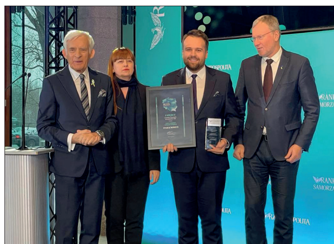
Marek Materek prezydent Starachowic

- Chcemy, aby mieszkańcy mogli załatwiać maksymalnie dużo spraw przez internet. To kwestie urzędowe, ale także związane ze szkołami, przedszkolami czy jednostkami organizacyjnymi.