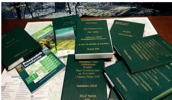
Dokumenty i opracowania dotyczące gospodarki leśnej.

jątkowo cennych lasów jest wyłączonych z użytkowania wewnętrzną procedurą LP.