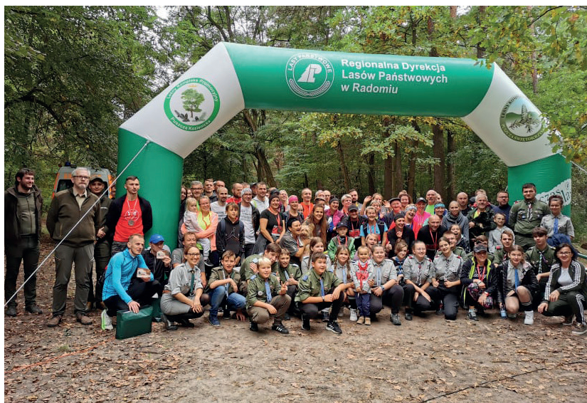
Bieg Szarych Szeregów, Nadleśnictwo Kielce.

Leśnicy podkreślają, że możliwa jest realizacja różnych funkcji lasu – od gospodarczych, po ochronne i społeczne. Nadrzędną zasadą prowadzenia gospodarki leśnej zawartą w ustawie o lasach jest zachowanie trwałości lasu, czemu służą różne rodzaje prac, od pielęgnacji lasu, po działania z zakresu ochrony lasu, aż do takich, których celem jest odnawianie lasów. Wiele z tych zabiegów wiąże się z wycinaniem drzew, każda powierzchnia jest odnawiana – przez sadzenie lub naturalnie. W lasach następuje przemiana pokoleń, zmienia się także skład gatunkowy – lasy są coraz bardziej odporne na zmiany klimatyczne, leśnicy sadzą coraz więcej drzew liściastych. ◀