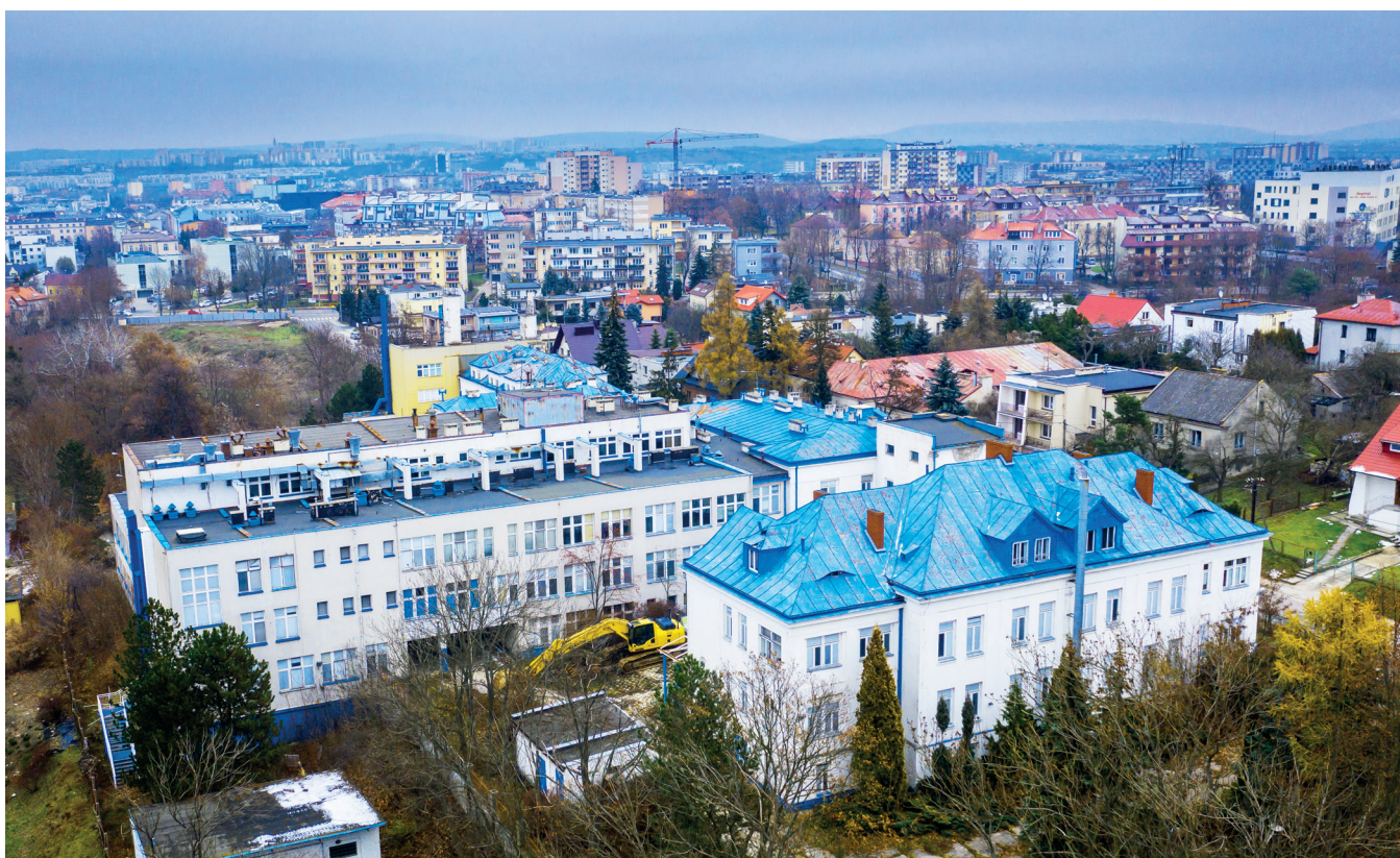
Czy w budynku po „szpitaliku” powstanie szpital uniwersytecki?

Oprócz koncepcji powstania nowego szpitala przy ulicy Langiewicza rozważanych jest kilka innych wariantów. To także uczynienie Wojewódzkiego Szpitala Zespołonego szpitalem uniwersyteckim lub wykup Szpitala Kieleckiego. ◀