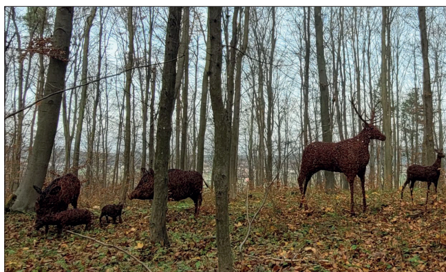
Wiklinowe zwierzęta na ścieżce edukacyjno-przyrodniczej

W ramach zadania „Budowa ścieżki edukacyjno-przyrodniczej w msc. Szewce” do końca roku zostanie wykonane zagospodarowanie trasy ścieżki wytyczonej na górach Miejskiej oraz Okrąglicy wraz z budową wiatrołapów, tablic informacyjnych. Lokalizacja trasy w najbardziej atrakcyjnej przyrodniczo części gminy pozwoli na podziwianie uroków przyrody oraz poszerzenie wiedzy o gatunkach roślin i zwierząt spotykanych na terenie gminy. - Dodatkowo w przyszłym roku planuje się opracowanie i udostępnienie aplikacji mobilnej pozwalającej na rozszerzenie informacji o terenie oraz umożliwienie prowa-