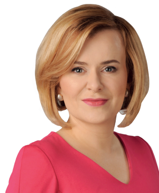
Biuro Poselskie Posel RP ANNY KRUPKI, ul. Jana Pawła II 13/18 25-025 Kielce woj. świętokrzyskie, tel. 608 045 712

Politycy PiS mają również promować założenia Polskiego Ładu. – Zorganizujemy spotkania we wszystkich gminach województwa świętokrzyskiego. Będziemy wyjaśniać na czym polegają założenia naszych propozycji, ponieważ opozycja często zniekształca ich obraz. Przedstawiliśmy dziesięć kluczowych zmian w ramach Polskiego Ładu, które przeprowadzimy w trakcie najbliższych stu dni – dodaje Anna Krupka. ◀