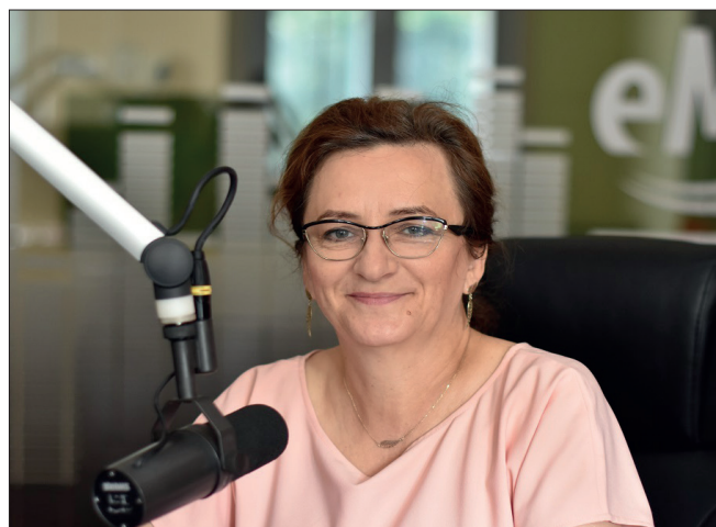
Agata Wojtyszek Poseł na Sejm RP, PiS

Poseł należy także do Parlamentarnego Zespołu do Spraw Życia i Rodziny, który stoi na straży wartości rodziny.