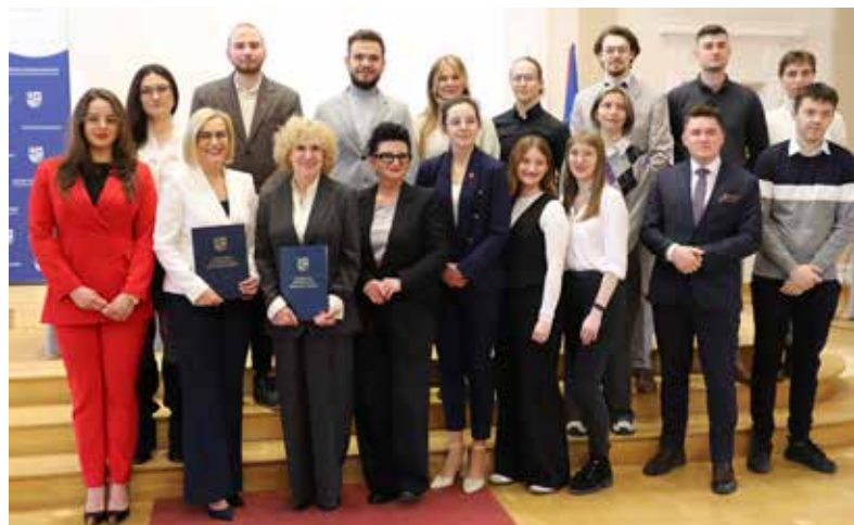
W uroczystym podpisaniu umowy wzięli udział studenci Uniwersytetu Jana Kochanowskiego w Kielcach.