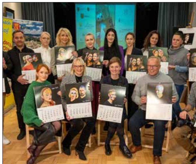
autor: Nina Wrzosek

wrzucić gotówkę do jednej z puszek, które można znaleźć w Domu Kultury „Zameczek”, Ośrodku Kultury „Ziemowit”, Kieleckim Centrum Kultury, Pałacyku Zielińskiego, Pocztylni na dVoRcu – Mediateka, Klubie Tapas i w Manufakturze Słodczy. Całość kwoty zostanie przekazana potrzebującym, część z niej szpital przeznaczy na rehabilitację. ◀