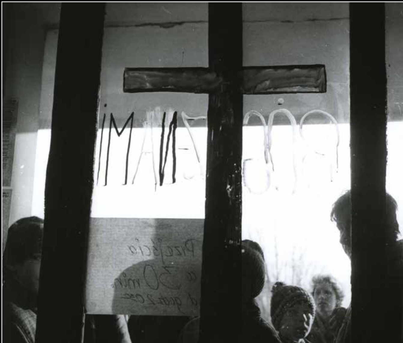
Fotografia operacyjna Służby Bezpieczeństwa ze strajku młodzieży w grudniu 1984 r.

do historii obrońców Westerplatte w 1939 r. W dziejach diecezji kieleckiej protest młodzieży miał być „najodważniejszym, najpotężniejszym świadectwem danym Chrystusowi”.