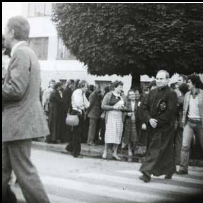
Fotografia operacyjna Służby Bezpieczeństwa wykonana podczas procesu księży w Jędrzejowie w czerwcu 1985 r.