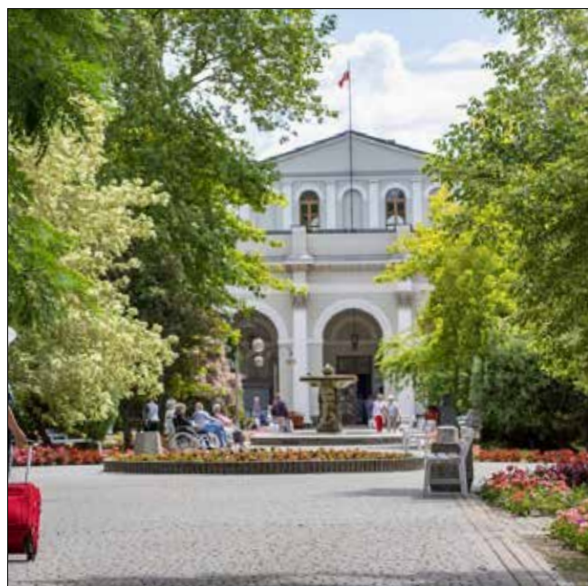
autor: Michał Kita

kapitał zakładowy Uzdrowiska Busko-Zdrój wyniesie 36 milionów złotych. ◀