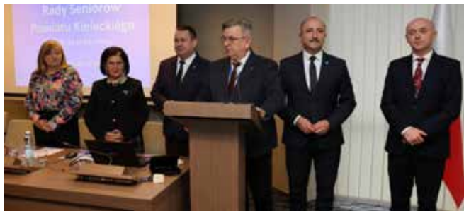
Zarząd Powiatu w Kielcach podczas spotkania z seniorami.

Polityka społeczna pozostaje jednym z priorytetów działania Zarządu Powiatu w Kielcach. Udowodniły to ostatnie dni, kiedy odbyło się kilka interesujących wydarzeń związanych z tą tematyką. Z okazji Ogólnopolskiego Dnia Seniora, seniorzy z powiatu kieleckiego mieli okazję uczestniczyć w prelekcjach dotyczących zdrowego odżywiania, aktywności fizycznej oraz bezpieczeństwa, zorganizowanych w siedzibie starostwa.