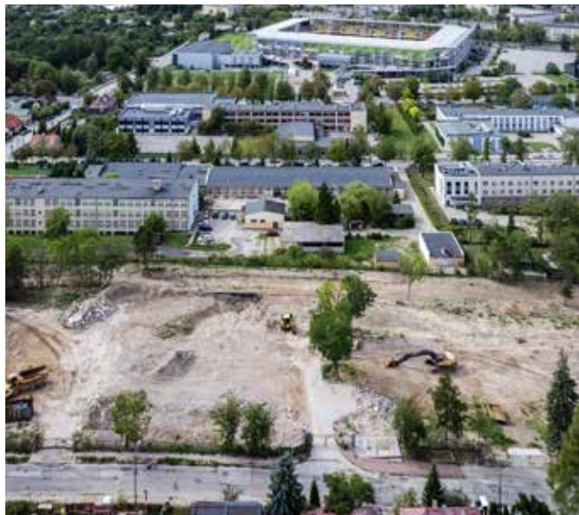
autor: Michał Kita

Działka po byłej lecznicy dziecięcej w Kielcach pójdzie pod młotek. Zgodę na sprzedaż gruntu przy ulicy Langiewicza wyrazili radni sejmiku województwa podczas październikowej sesji gremium. Ponad dwuhektarowy teren