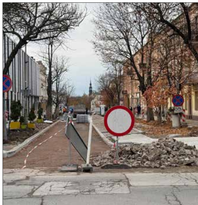
autor: Michał Kita

remoncie zyska ona nową nawierzchnię z kostki brukowej. Jezdnia zostanie zwężona, pojawią się miejsca postojowe dla samochodów. ◀