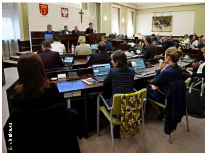
autor: Michał Kita

Ostatecznie za zaciągnięciem kredytu w EBI opowiedziało się 16 radnych, przeciw było ośmioro radnych z klubu Prawa i Sprawiedliwości. Pożyczka będzie wypłacana w czterech transzach do 2028 roku, na spłatę zobowiązania miasto będzie miało 20 lat. ◀