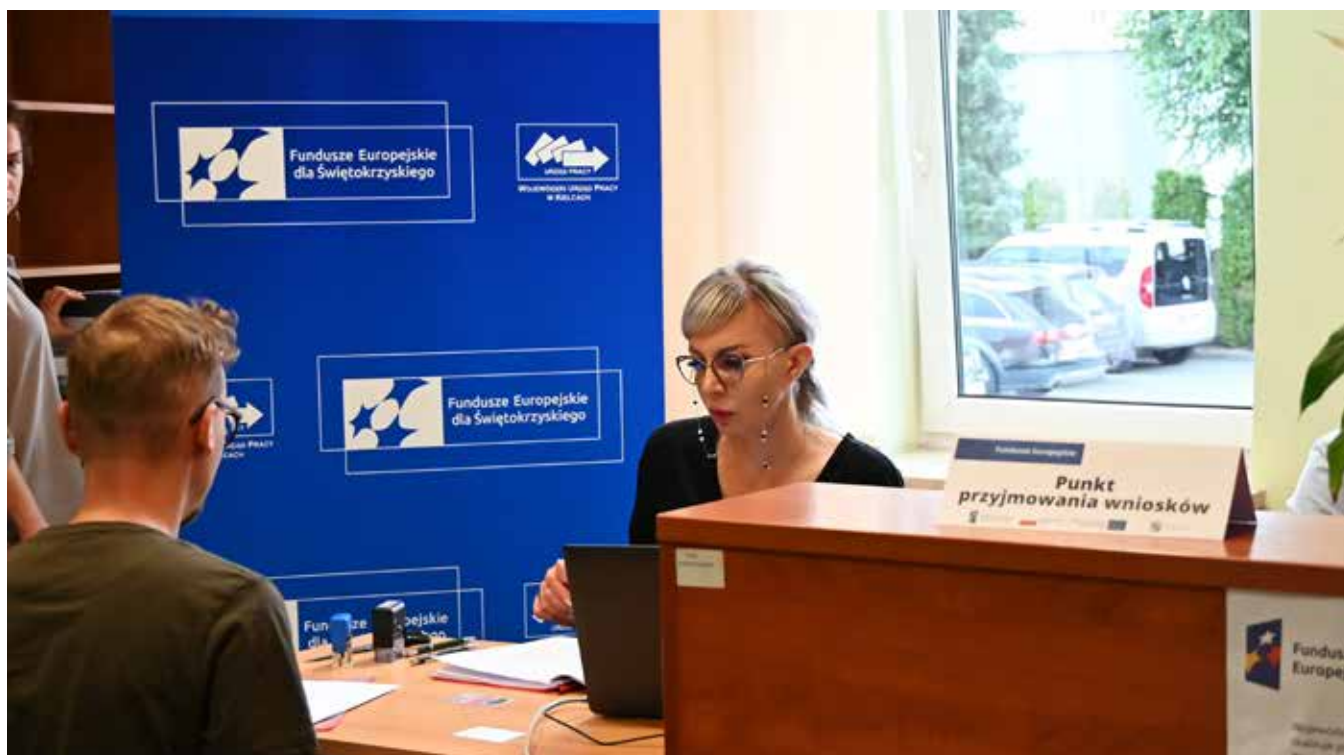
Punkt przyjmowania wniosków w WUP

Serdecznie zapraszam mieszkańców regionu do udziału w projektach Wojewódzkiego Urzędu Pracy. Wysokie kwalifikacje to poczucie bezpieczeństwa, wyższy standard życia i otwartość na nowe wyzwania. Kwota przeznaczona w obecnej perspektywie finansowej na indywidualne podnoszenie kompetencji mieszkańców regionu jest ogromna i wynosi ponad 42 miliony złotych. Kolejne 36,5 miliona przeznaczyliśmy na rozwój umiejętności pracodawców i ich pracowników. Dostępność wykwalifikowanych kadr czyni region świętokrzyski atrakcyjnym miejscem do inwestowania i godnego życia. Warto zatem kształcić się niezależnie od wieku, wykształcenia i zdobytego zawodu.