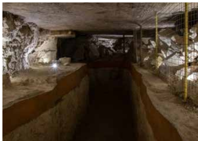
autor: Michał Kita

Kopalnie krzemienia pasiastego i neolityczne osady w Krzemionkach zostały wpisane na Listę Światowego Dziedzictwa UNESCO w lipcu 2019 roku. ◀