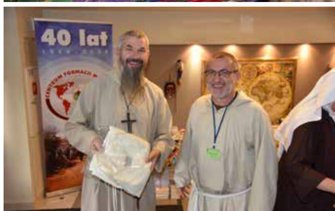
Na zdjęciu Misjonarki i Misjonarze odbierający dary z diecezji kieleckiej.