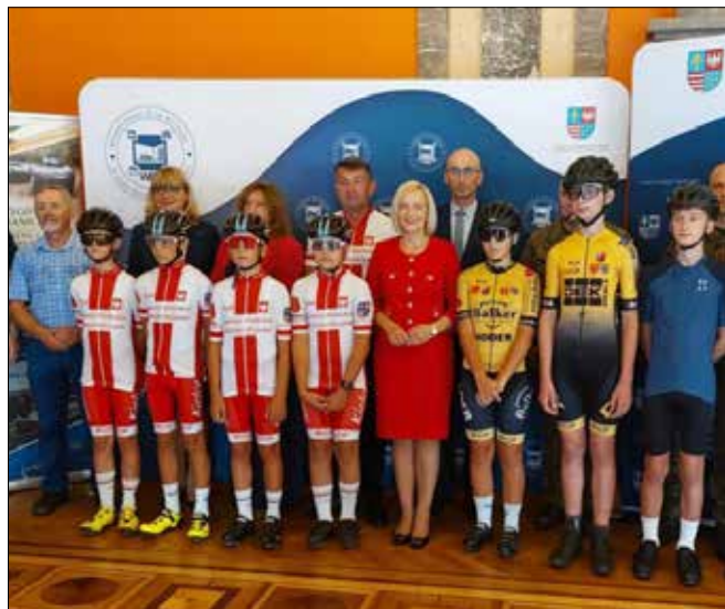
autor: Michał Kosiak

Inicjatorem upamiętnienia 80 żołnierzy 2. Dywizji Piechoty Legionów Wojska Polskiego w Kielcach, stanowiących trzon