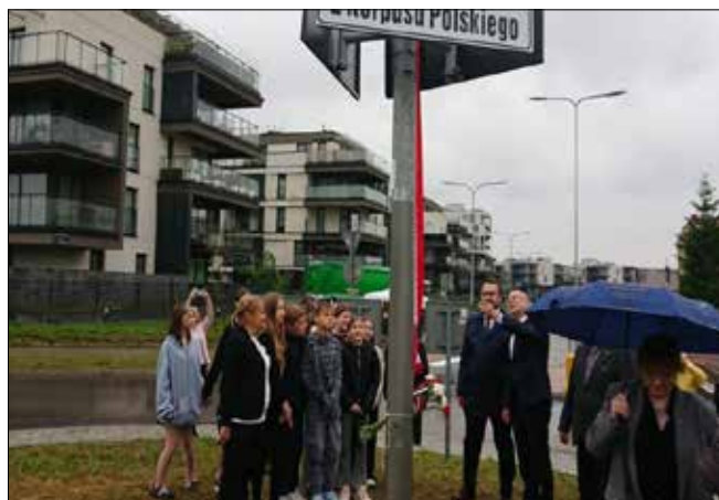
autor: Michał Kita

zaną z Kielcami w 2. Korpusie Polskim był Gustaw Herling-Grudziński, który za zdobycie włoskiego klasztoru na Monte Cassino został odznaczony orderem Virtuti Militari. Przypomnijmy: 18 maja 1944 roku oddziały 2. Korpusu Polskiego pod dowództwem generała Władysława Andersa zdobyły ruiny klasztoru na Monte Cassino. W natarciu na wzgórze zginęło 923 polskich żołnierzy, a 2931 zostało rannych. ◀