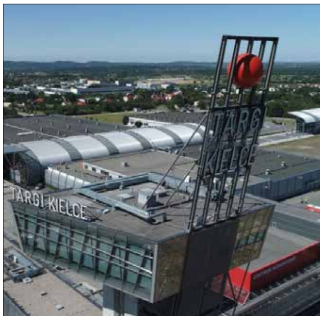
autor: Maciej Piętka

14 czerwca podczas konferencji prasowej na terenie Targów Kielce szefostwo spółki zapowiedziało budowę nowej hali. W inwestycji ma pomóc miasto, a budynek powstanie na placu niedaleko Zachodniego Terminalu.