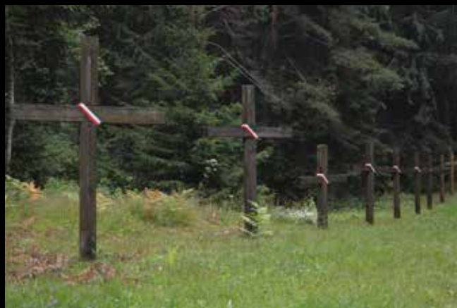
Kuropaty koło Mińska.