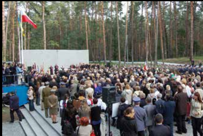
Cmentarz w Kijowie-Bykowni.