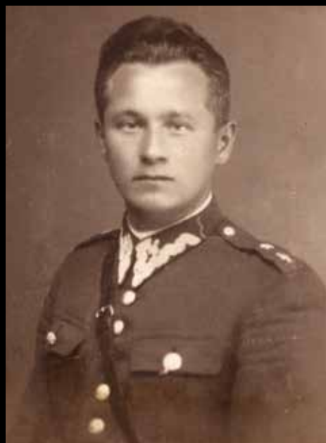
Leon Onyszkiewicz.