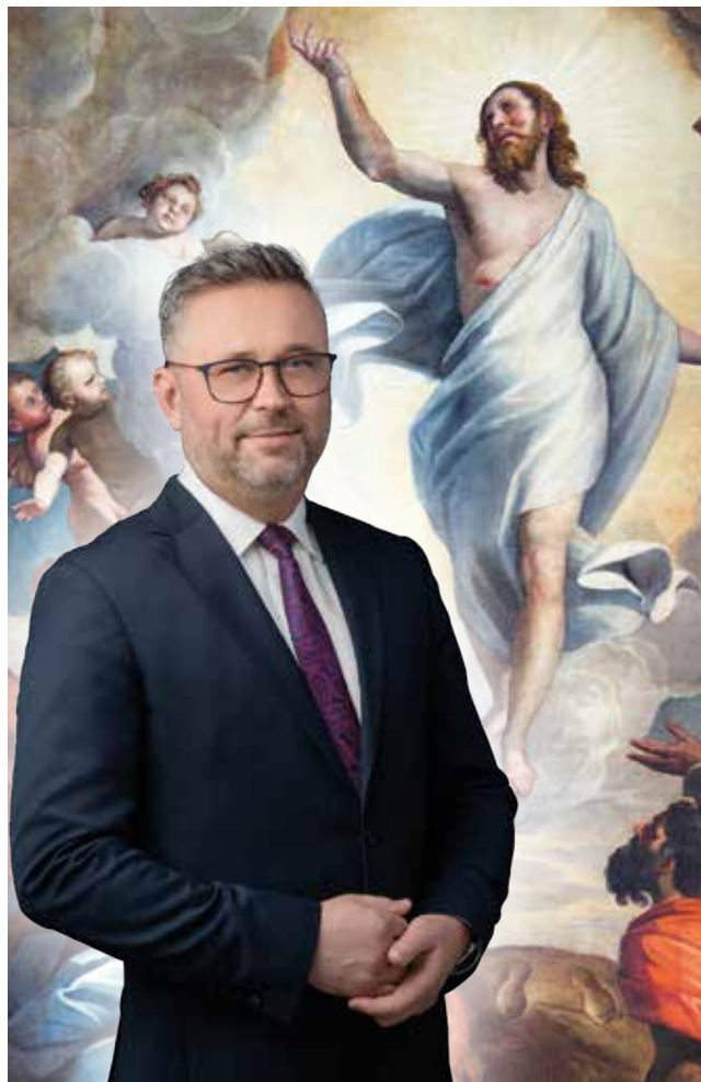
Materiał wyborczy KW Prawo i Sprawiedliwość

Niech Wielkanocne Święto Zmartwychwstania Pańskiego przypomni nam o mocy nadziei i odrodzenia, jakie niesie ze sobą wiara w Jezusa Chrystusa. Radosna okazja połączy nas w modlitwie, dzieleniu się miłością oraz w duchu wzajemnej życzliwości.