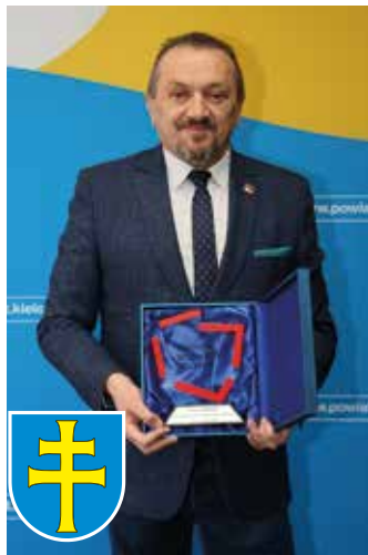
Starosta kielecki Mirosław Gębski z kolejną nagrodą

Od lat powiat kielecki jest wysoko oceniany w rankingu zajmując czołowe miejsca w kategorii powiatów powyżej 120 tys. mieszkańców. Dzięki konsekwentnej i efektywnej pracy, utrzymał najwyższą pozycję