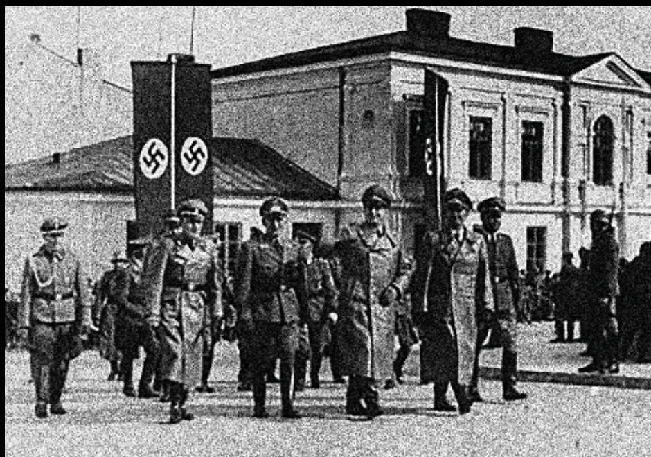
Generalny Gubernator Hans Frank w Kielcach w czasie II wojny światowej.

zmierzającej najpierw do depopulacji, a następnie całkowitej zagłady ludności żydowskiej przedmiotem szczególnej wagi, zarówno w okresie istnienia dużego getta kieleckiego, a następnie małego getta i przyzakładowych obozów pracy, stało się zdobycie żywności, medykamentów oraz wszelkich rzeczy potrzebnych do przeżycia. Co oczywiste z inicjatywą ich pozyskania wychodzili Żydzi, bo to oni tej pomocy potrzebowali. O żywność w miastach było szczególnie trudno. Legalnie można ją było zdobyć tylko na kartki. Nie może zatem dziwić, że w dostarczaniu pożywienia do getta kieleckiego udział brali polscy mieszkańcy okolicznych miasteczek i wiosek. Znacznie rozwinął się handel wymienny i szmugiel między gettem, a tzw. stroną aryjską.