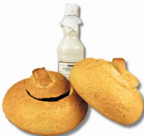
Chleb do zuru i Barszcz Biały