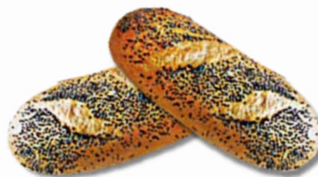
Chlebki do koszyczka