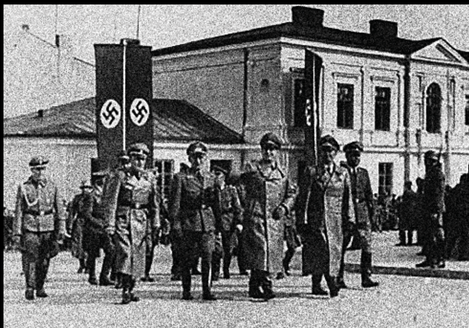
Generalny Gubernator Hans Frank w Kielcach w czasie II wojny światowej.

zmierzającej najpierw do depopulacji, a następnie całkowitej zagłady ludności żydowskiej przedmiotem szczególnej wagi, zarówno w okresie istnienia dużego getta kieleckiego, a następnie małego getta i przyzakładowych obozów pracy, stało się zdobycie żywności, medykamentów oraz wszelkich rzeczy potrzebnych do przeżycia. Co oczywiste z inicjatywą ich pozyskania wychodzili Żydzi, bo to oni tej pomocy potrzebowali. O żywność w miastach było szczególnie trudno. Legalnie można ją było zdobyć tylko na kartki. Nie może zatem dziwić, że w dostarczaniu pożywienia do getta kieleckiego udział brali polscy mieszkańcy okolicznych miasteczek i wiosek. Znacznie rozwinął się handel wymienny i szmugiel między gettem, a tzw. stroną aryjską.