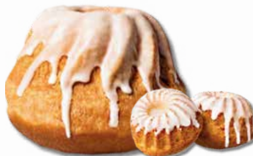
Babka drożdżowa i babeczki do koszyczka